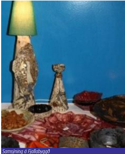
Samsýning á Fjallabyggð