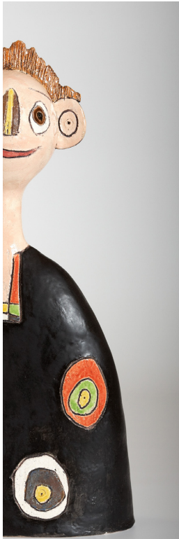
Sólarupprás í Vatnsmýrinni