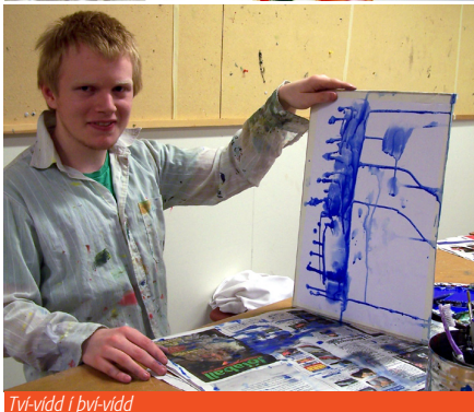
Tví-vidd í þrí-vidd