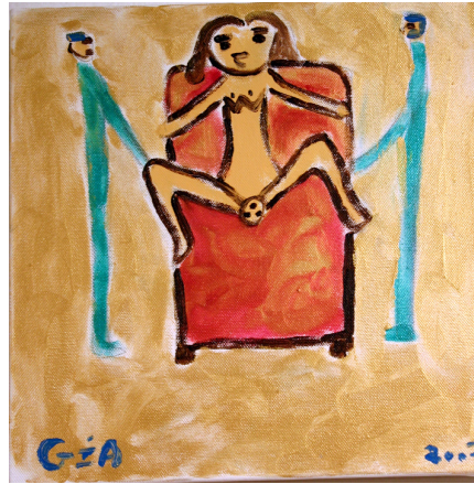
Samsýning í Ráðhúsi Reykjavíkur